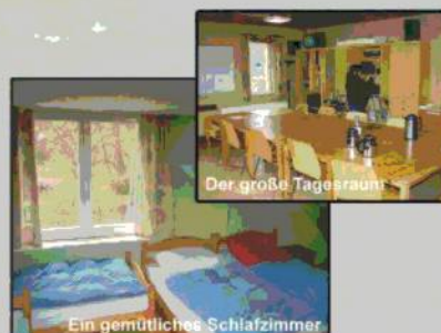
Der große Tagesraum