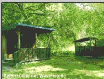
Zelterküche mit Waschstelle